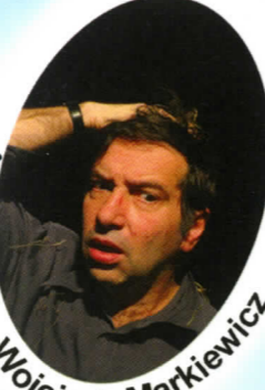
Reżyser - Wojciech Markiewicz