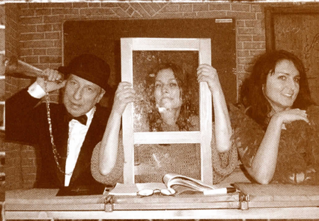
GŁUCHY KOBIETA Z WINDOWS PIERSIÓWA