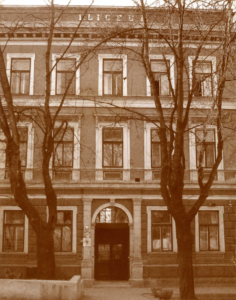
Liceum Ogólnokształcące im. Kazimierza Brodzińskiego w Tarnowie