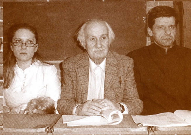
NIEOBECNA KAŁGENIUSZ REPETENT